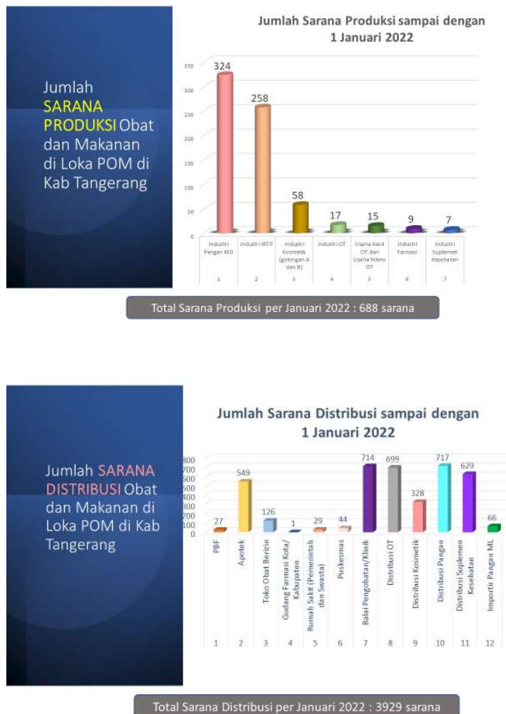
Gambar 4. Jumlah sarana produksi dan sarana distribusi

Loka POM di Kabupaten Tangerang memiliki total sarana produksi obat dan makanan sebanyak 688 sarana dan 3929 sarana distribusi obat dan makanan yang menjadi sasaran pengawasan dengan rincian sebagai berikut: