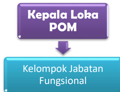
Gambar 2. Struktur Organisasi Loka POM Kabupaten Tangerang

Berdasarkan Peraturan BPOM Nomor 22 tahun 2020 tentang Organisasi dan Tata Kerja Unit Pelaksana Teknis di Lingkungan Badan POM sebagaimana diubah dengan Peraturan BPOM Nomor 23 tahun 2021 dijelaskan mengenai tugas dari Loka POM sebagai salah satu UPT BPOM. Loka POM mempunyai tugas melakukan inspeksi dan sertifikasi sarana/fasilitas produksi dan/atau distribusi Obat dan Makanan dan sarana/fasilitas pelayanan kefarmasian, sertifikasi produk, pengambilan contoh ( sampling ), dan pengujian Obat dan Makanan, intelijen, penyidikan, pengelolaan komunikasi, informasi, edukasi, pengaduan masyarakat, dan koordinasi dan kerja sama di bidang pengawasan Obat dan Makanan, serta pelaksanaan urusan tata usaha dan rumah tangga.