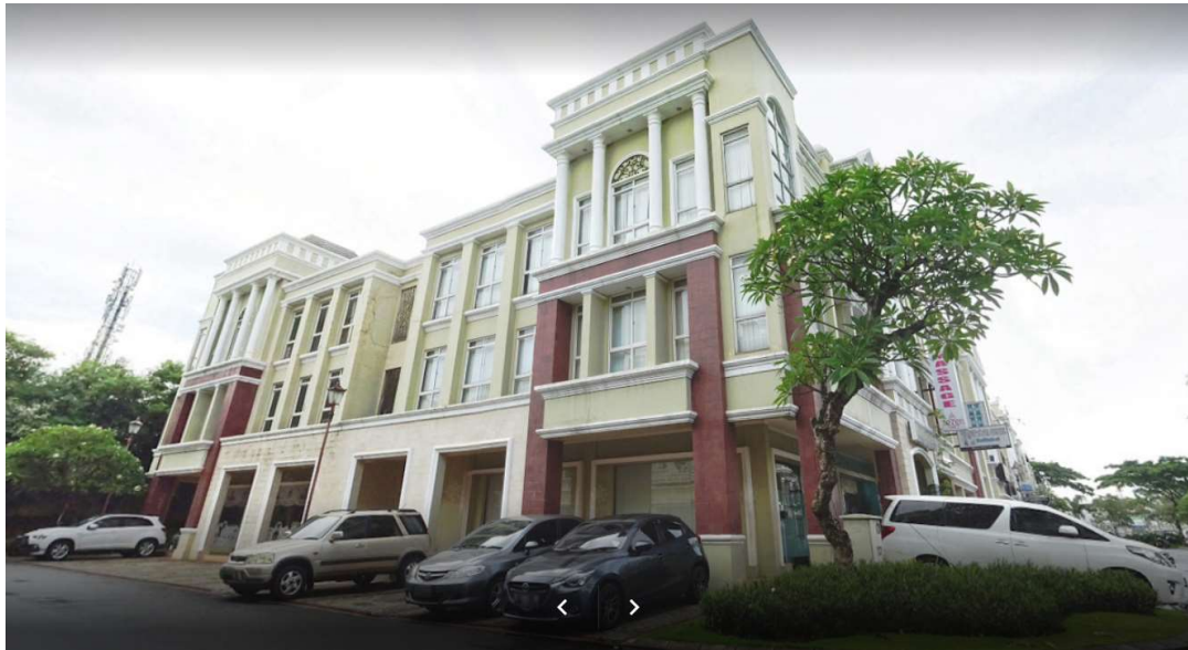
Gambar 1. Gedung Kantor Loka POM di Kabupaten Tangerang